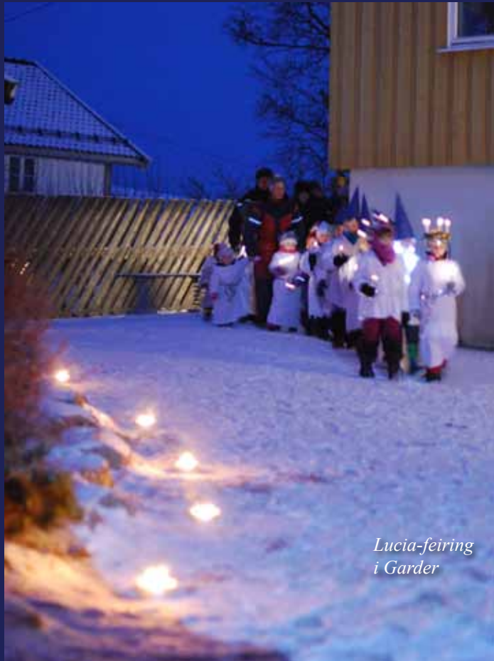
Lucia-feiring i Garder

Husets 4 åring har fått med seg at lys er viktig når vi feirer Lucia. I forbindelse med årets feiring får vi kanskje benytte anledningen til en hyggelig lesestund i sofaen, så kanskje enda mer av legenden om Lucia kan «få komme frem i lyset».