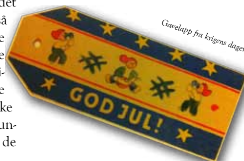
Gavelapp fra krigens dager

Jeg synger julekvad jeg er så glad, så glad! Min hjertens Jesus hviler i stall og krybbe trang, som solen klare smiler han på sin moders fang. :/:Han er Frelser min! :/: