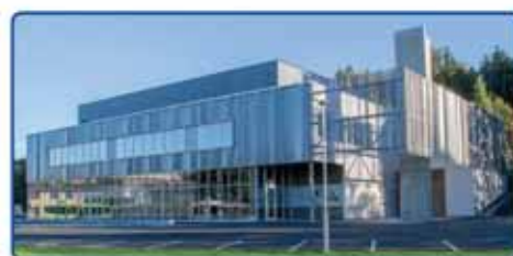
Smia Flerbrukshus - Frogn

Vi utfører nybygg og rehabilitering innen privat og offentlig sektor