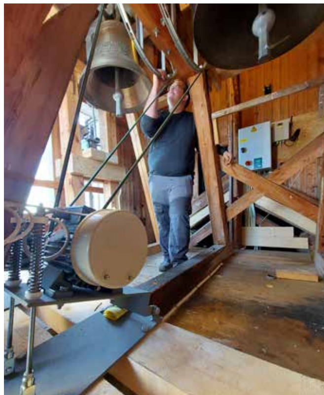
Heretter kommer ringingen fra Eina kirke til å være skånsom for både hørsel og kropp generelt

I tillegg til firmaet Olsen Nauen har kirketjenerne gjort forberedelser som måtte på plass før montering. De har trekt styrekabler og forberedt for montering av skap og motorer. Dette gjør en stor forskjell i hverdagen for vår kirketjener, da den manuelle ringingen kunne tære på både kropp og hørsel. Eina menighetsråd er også veldig godt fornøyd med resultatet av dette prosjektet.