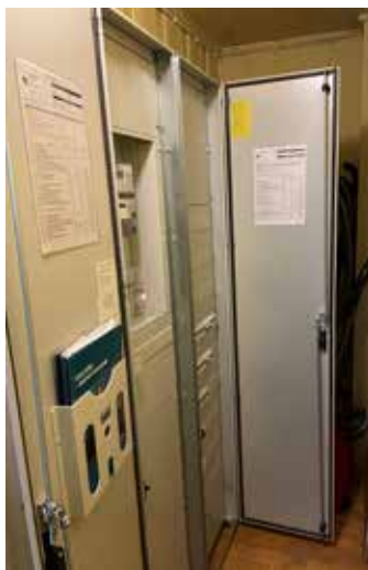
Ny el-tavle erstatter gamle sikrings-skap

I Eina kirke har vi hatt manuell ringing i 131 år, og alle som har vært med på dette vet at det er en anstrengende jobb. Vi har gjennom tidene hatt mange dyktige kirketjenere som har satt sitt preg på ringingen. Noen var litt skeptiske og at de kom til å høre forskjell, men når vi i dag hører resultatet er det bare positive kommentarer. De færreste kan høre en forskjell fra den manuelle ringingen.