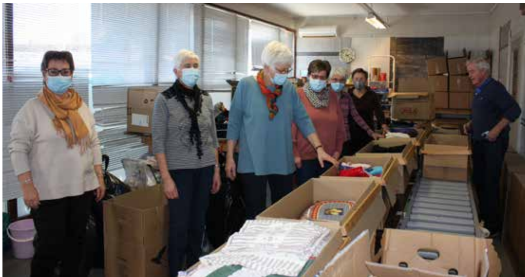
Ting og tøy på Raufoss er godt bemannet. Her pakkes klær som skal videre til Øst-Europa.

Middagsserviser og kopper står på rekke og rad. Klesplagg, sko og skistøvler i klare farger pryder bord og hyller. Møbler, lamper og heklede duker er utstilt. Tulipanvaser i glass skinner, og lyset faller over de forgylte bokryggene på de antikvariske bøkene.