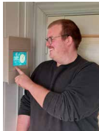
Betjening av klokkene kan bl.a skje via touch-panel i prestesakrestiet.

Tekst Lars Arne Mjørland For at vi skulle ivareta de lokale ringeskikkene ble det på forhånd sendt inn hvordan ringeskikkene på Eina kirke ble utført. Dette ble tilpasset i ringeprogrammene ved igangkjøring.