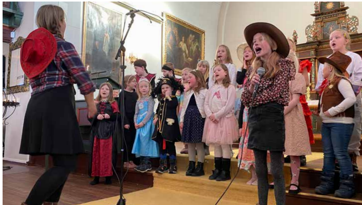
Vestre Toten Soul Kids og Vestre Toten Soul Children hadde kledd seg ut for anledningen og skapte liv og røre i kirka.