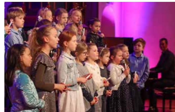
Bilde fra koret sin julekonsert i Raufoss kirke.

Torsdag 8. juni inviterer vi til en storslått konsert i Fyrverkeriet kulturhus med Vestre Toten Soul Kids og Soul Children, der vi skal opptre sammen med band, artister og dansere.