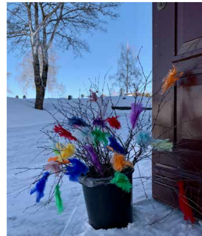
Sanitetsforeningen hadde pyntet så fint og serverte fastelavnsboller til kirkekaffen.