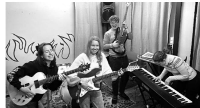
Fra bandøving i det nye øvingsrommet i Raufoss kirke.

Det siste året har det skjedd spennende ting bak orgelet i Raufoss kirke. Vi har nemlig etablert vårt eget ungdomsband i kirken, og ungdommene har selv innredet sitt eget