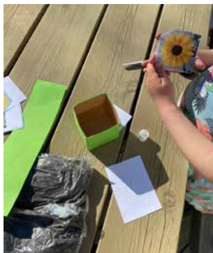
Kan virkelig dette lille frøet bli en plante på flere meter? Litt å undre seg over.