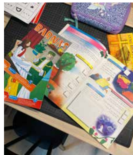
Påsepakke til Sprell-barna

omkring på sensommeren. Siste samling før sommeren skulle vært 7. mai, derfor fikk Sprellbarna en siste pakke i postkassen før 17. mai. Med det ønsker vi alle en god sommer og vi satser på oppstart torsdag 17. september. Da håper vi å se mange kjente fjes, men også noen nye. Hvis du er 5 år og oppover er du hjertelig velkommen til å bli med på Sprell-samlinger annenhver torsdag i Kirkekjelleren. Vi synger, hører en bibelfortelling, gjør en formingsaktivitet og til slutt spiser vi kveldsmat sammen.