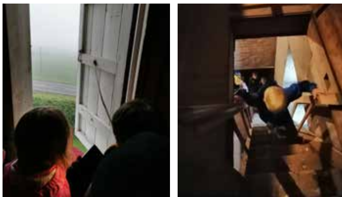
En tur opp i kirketårnet hører selvsagt med på Tårnagentsamling.