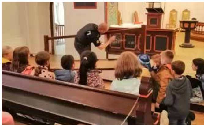
Ekstra spennende med politiet på besøk som viser hvordan de finner fingeravtrykk.