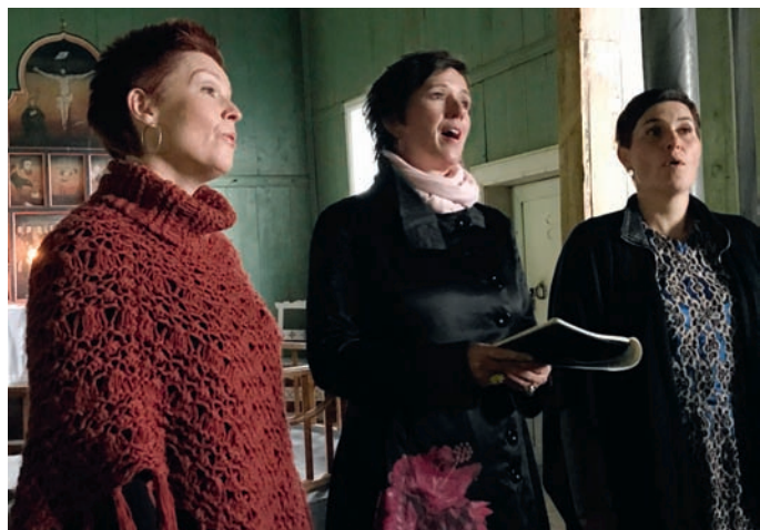
Gruppen Trio Mediaeval