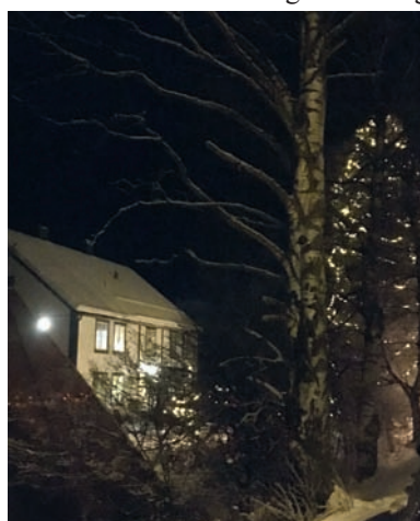
Prestegarden er ei nydeleg ramme rundt eit julemarked!

sangen 'Nå tennes tusen julelys' blei det flottaste treet i heile Valdres, med heile 3400 lys på, tent! Ramma rundt marknaden kunne ikkje vore betre, med snø, ein vakker prestegard og mange glade og entusiastiske folk som gleda seg i saman.