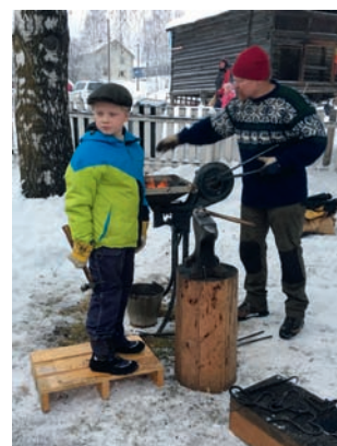
Tidleg krøkjast skal ein bli ein god krok