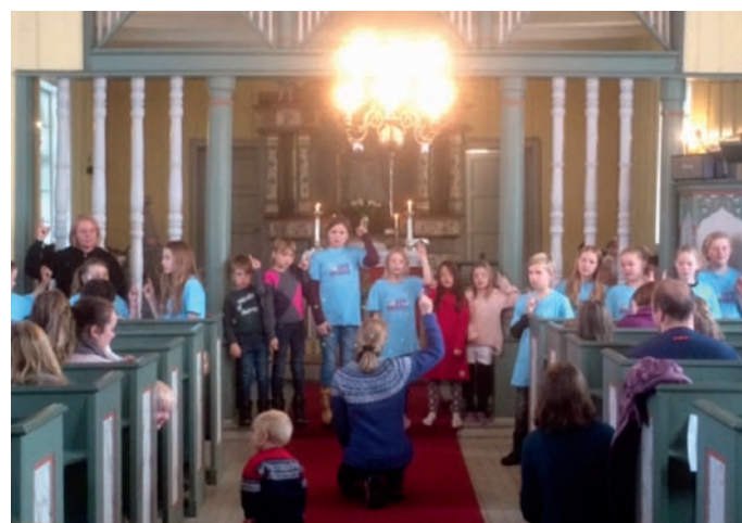
Barn frå søndagsskulen og «Lys våken» sang «Min båt er så liten».