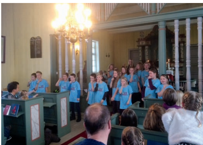
Søndag var dei med å ringe i kyrkjeklokkene og tok del i gudstenesta med dans og bønner dei hadde skrive sjølv.

overnatte i Røn kyrkje frå laurdag 18. til søndag 19. november. Dei møtte opp med lommelykter i ei stummande mørk kyrkje og skulle finne refleksar med bibelvers. Etterpå var det lysandakt før salmebokstabling og andre morosame aktivitetar. Seint på kvelden åt dei taco og ingen la seg før midnatt.