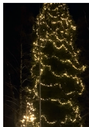
Sølvfurua er tent med 3400 lys