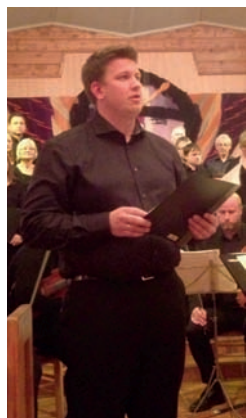
Are Alund leia kvelden

Koret var samansett av 40 songarar frå heile Valdres. Dei var godt førebudde etter mange, lange øvingskveldar og leverte song av imponerende høg kvalitet.