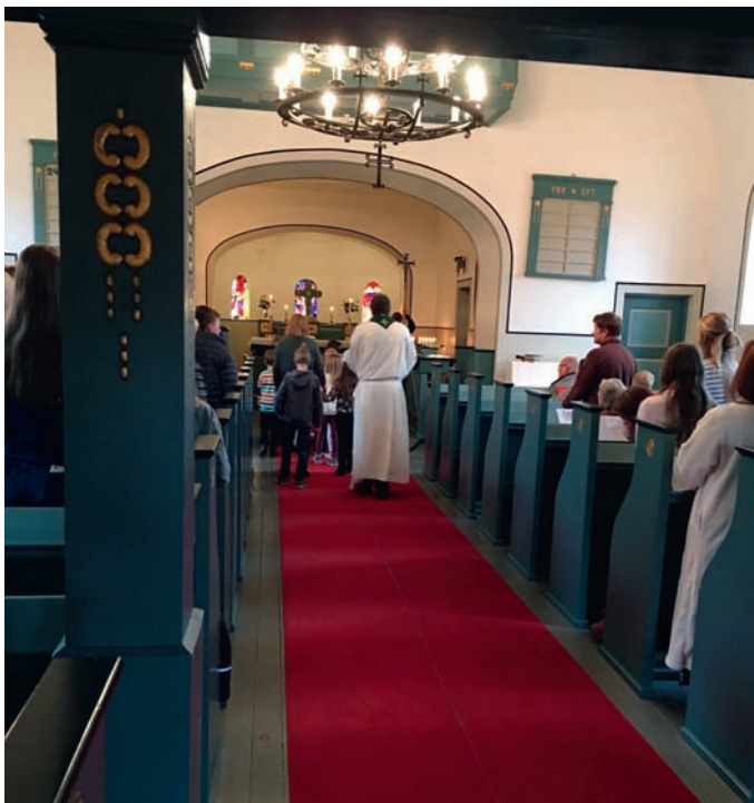
Barna gjekk inn i prosesjon med haustens grøde.

Søndag 15.oktober møtte det opp mange forventningsfulle 6-åringar i Lomen kyrkje. Både far, mor og fleire besteforeldre var med.