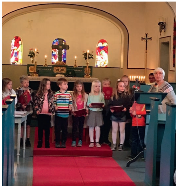
Dei fekk utdelt 6-årsboka med helsing frå kyrkja.