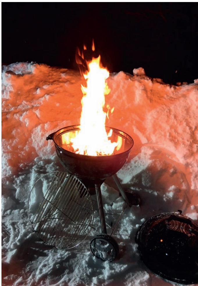
På akekvelde ved Jomsborg var det pølsegrilling og varm saft mellom øktene.