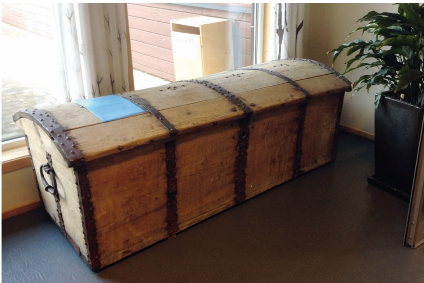
Bilde av kista på brukartorget