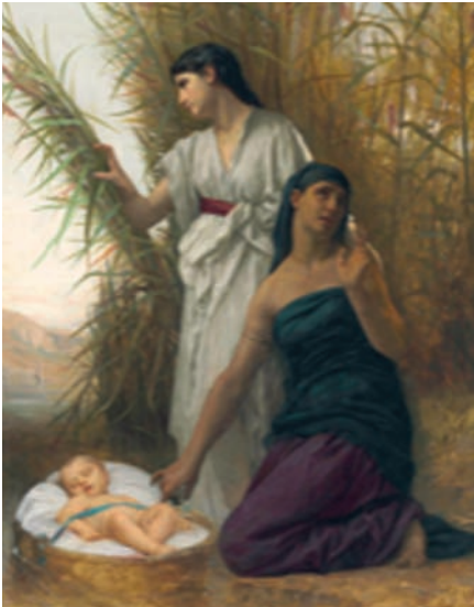
Moses in the basket av Elisabeth Jane Gardner (1837–1923).

Då er det duka for baby Moses. For å sleppe unna dei egyptiske mordarane la mora den vesle ungen sin i ei sivkorg, og sette den ut på vatnet i Nilen. Storesyster Miriam fylgde etter for å sjå korleis det gjekk. Dotter til Faraο fann han, tykte synd om han og tok han til seg. Då var Miriam på pletten med forslag til amme - guten si mor - og slik vart det. Kongsdottera fostra han opp som sin eigen son og gav han namnet Moses.