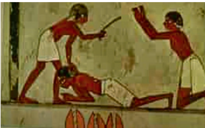
Slavepisking, gravmålestykke frå Egypt, ukjent kunstnar.

Dødens engel skulle gå gjennom landet og ta livet av alle fyrstefødde blant både menneske og dyr.