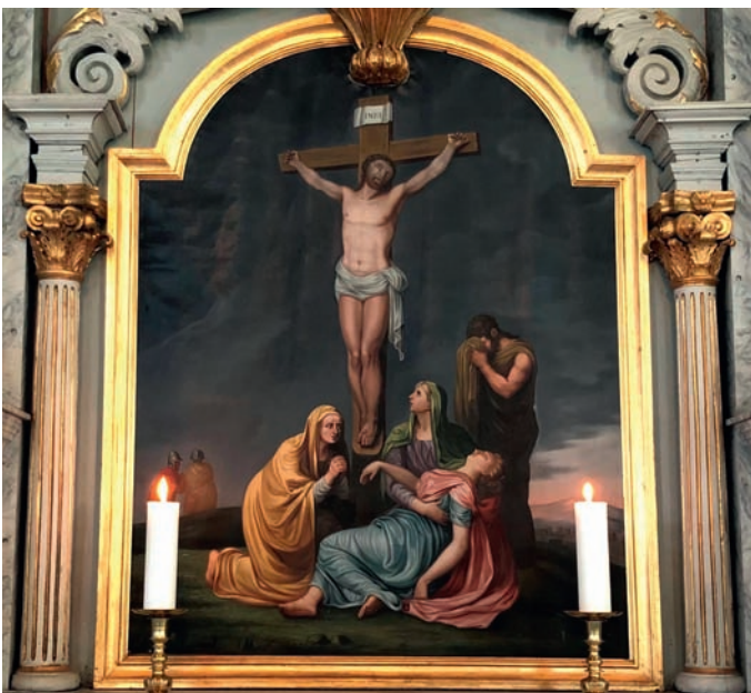
Altertavle frå Sør-Fron.

Kan det finnast ein god Gud, når det er så mykje vondskap i verda? Det spørsmålet står framleis uløyst, men det står ikkje utan svar. Gud er skjult