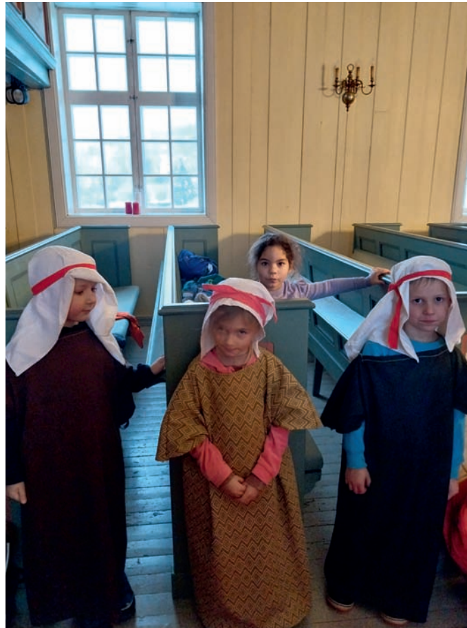
Tør vi dette, då?

var engelen Gabriel, vert i herberget og keisar Augustus.