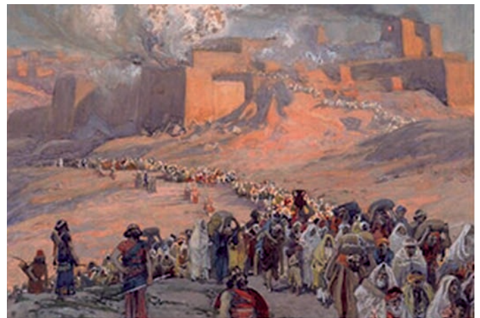
«Flukten fra Egypt» av James Jacques Tissot ca 1896-1902.

Medan døden på denne måten ramma Egypt, gav Faraο israelittane lov til å ta med seg buskapen sin og dra. Moses førde israelsfolket heile den strabasiøse turen gjennom Sinaiørkenen og fram til landet dei ein gong vart lova.