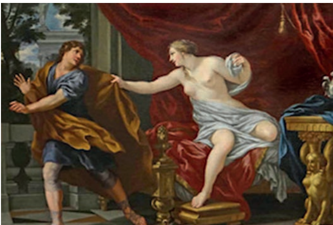
Fru Potifar av Ciro Ferri.