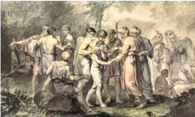
Josef og brødrene av Christoffer Wilhelm Eckersberg ca. 1811.

Sure og augensjuke var dei på Josef frå før, men no vart det verkeleg nok! Dei tok guten, sleit av han kappa og hvide han ned i ein tom brunn. Det fine plagget hans sulka dei til med blod frå eit slaktedy, og tok det med heim for å få Jakob til å tru at Josef var drepent.