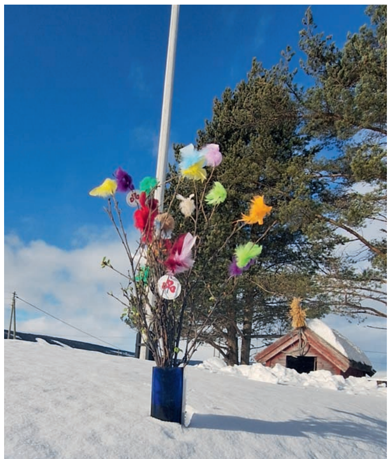
Fastelavnsris gjev glede lenge.