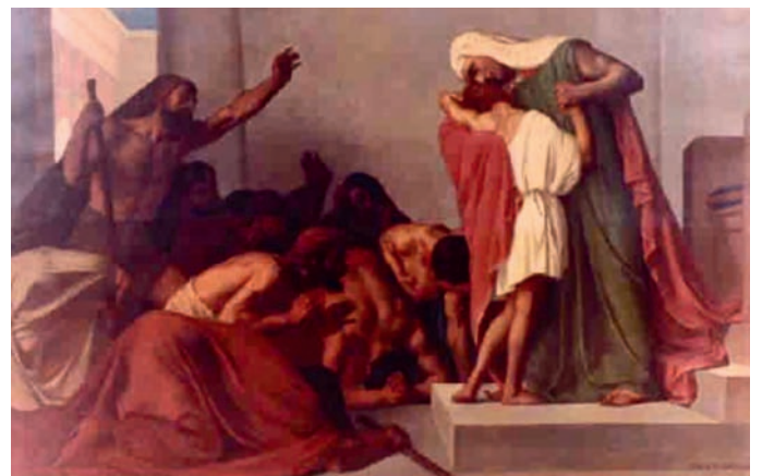
Reunion, josef blir attkjend av brørne. Av Leon Pierre Urbain Bourgeois.

Snart vart dei mange. Jakobs 12 søner vart stamfedre til 12 stammer. Dei vart kalla isrealittar.