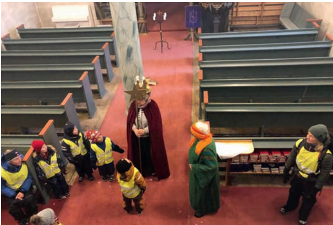
Velkomen til julevandring!

Tysdag 12. desember var vi så heldige å få besøk av dei eldste borna i barnehagene i bygda. Dei gjekk til kyrkja som er nærast barnehagen sin; Røn kyrkje og Slidredomen. Der blei dei møtt av fleire frå staben ved kyrkja som i dette høvet