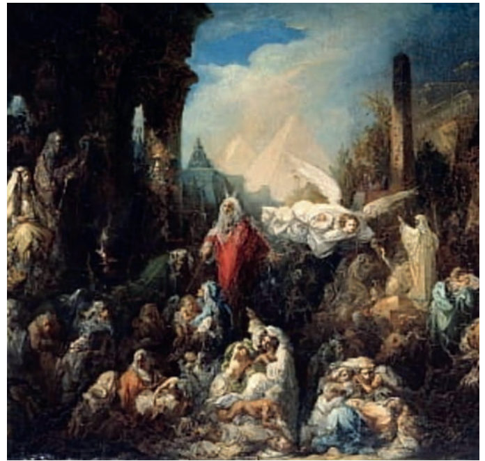
Dødens engel av Nikolai Petrovich Lomtev.

Israelittane fekk bod om å slakte eit lam. Med blodet frå lammet skulle dei markere dørstolpane og bjelken over døra. Der ville dødsengelen gå forbi.