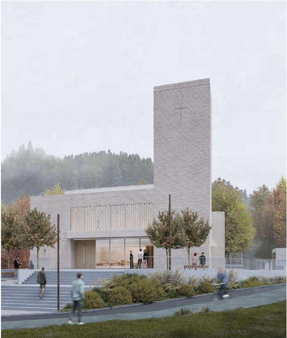
Illustrasjonen over er fra arkitektkonkurransen og viser kirkebakken og hovedinngangen med henvisning til Sædalen sentrum