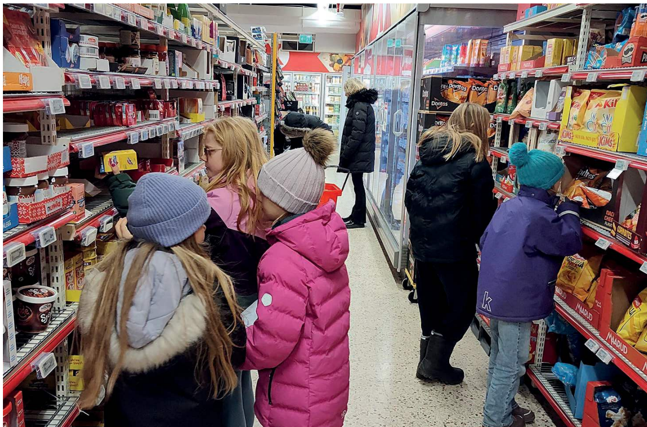
9-åringar i Ås menighet på «Agent for rettferdighet»-dag i Ås kirke: Bibelfortellinger, samtale og agentoppdrag i matbutikk for å finne etisk merkede varer.