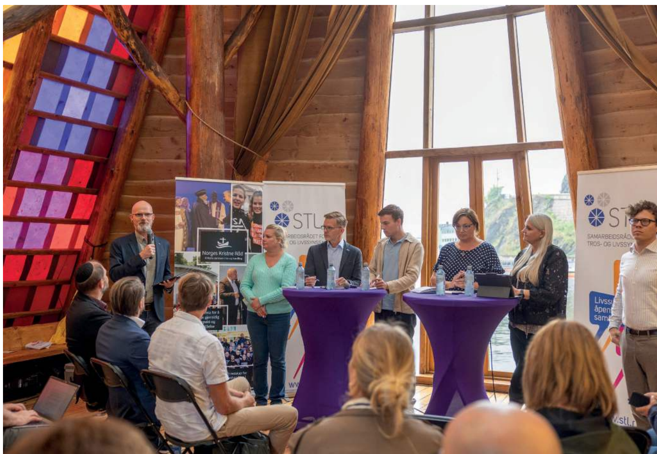
Det ble diskutert religionspolitikk så fillene føyk under Arendalsuka 2023.

og etter en del medieoppmerksomhet ba både styret og RPU administrasjonen utarbeide en vigselveileder som kunne danne en standard for hvordan våre medlemssamfunn skulle håndtere vigselseretten. Denne veilederen ble arbeidet med utover høsten, og etter kvalitetssikring hos Statsforvalteren ble den distribuert til våre medlemssamfunn og publisert på våre nettsider på nyåret.