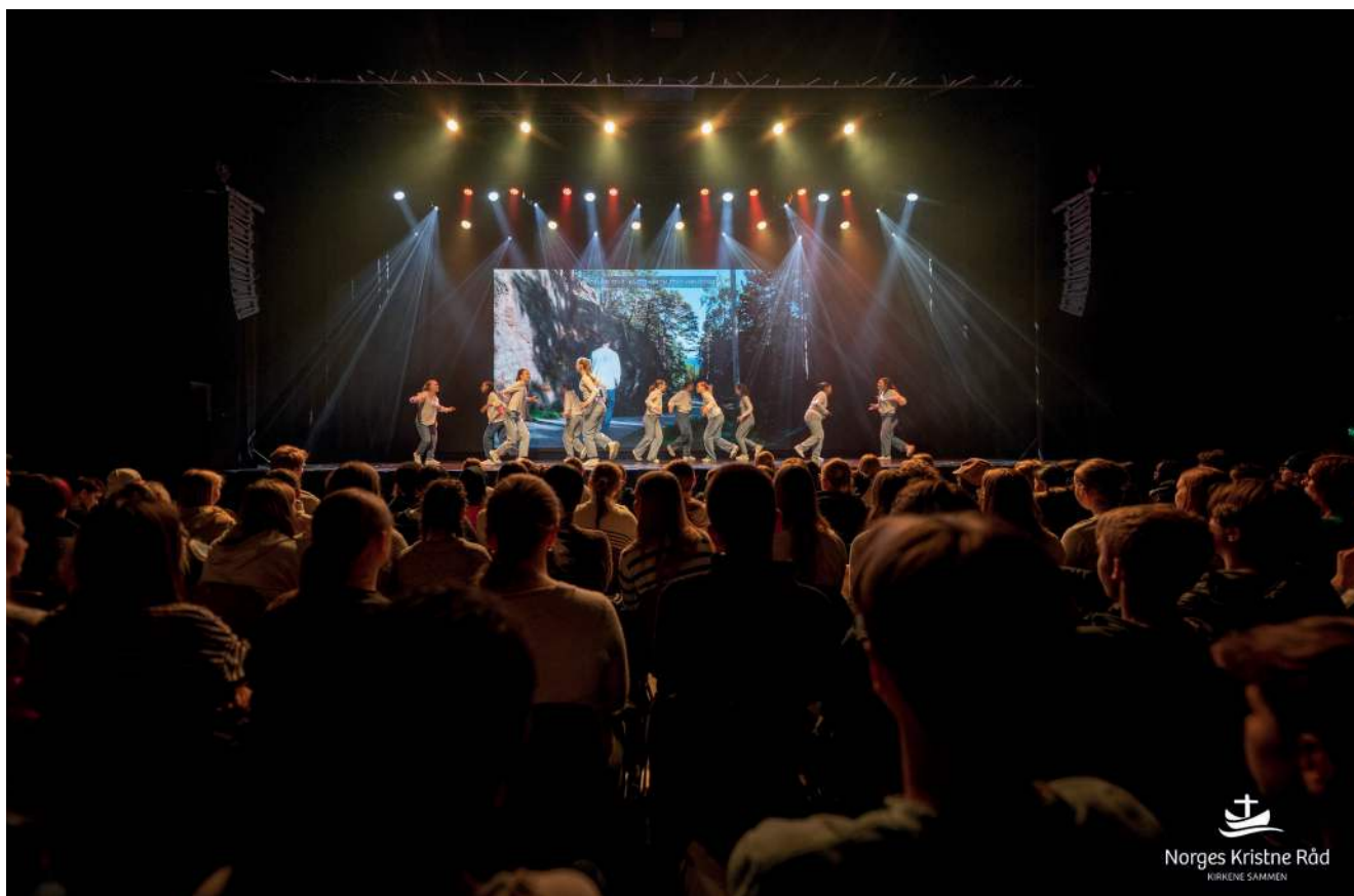
VINGESPENN: I Bergen. Hedmarktoppen Folkehøgskoles danselinje på scenen.

Nottingham University ga viktig innsikt.