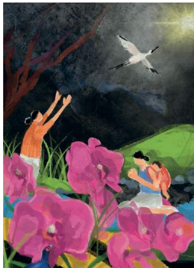
Årets kunstverk 2024