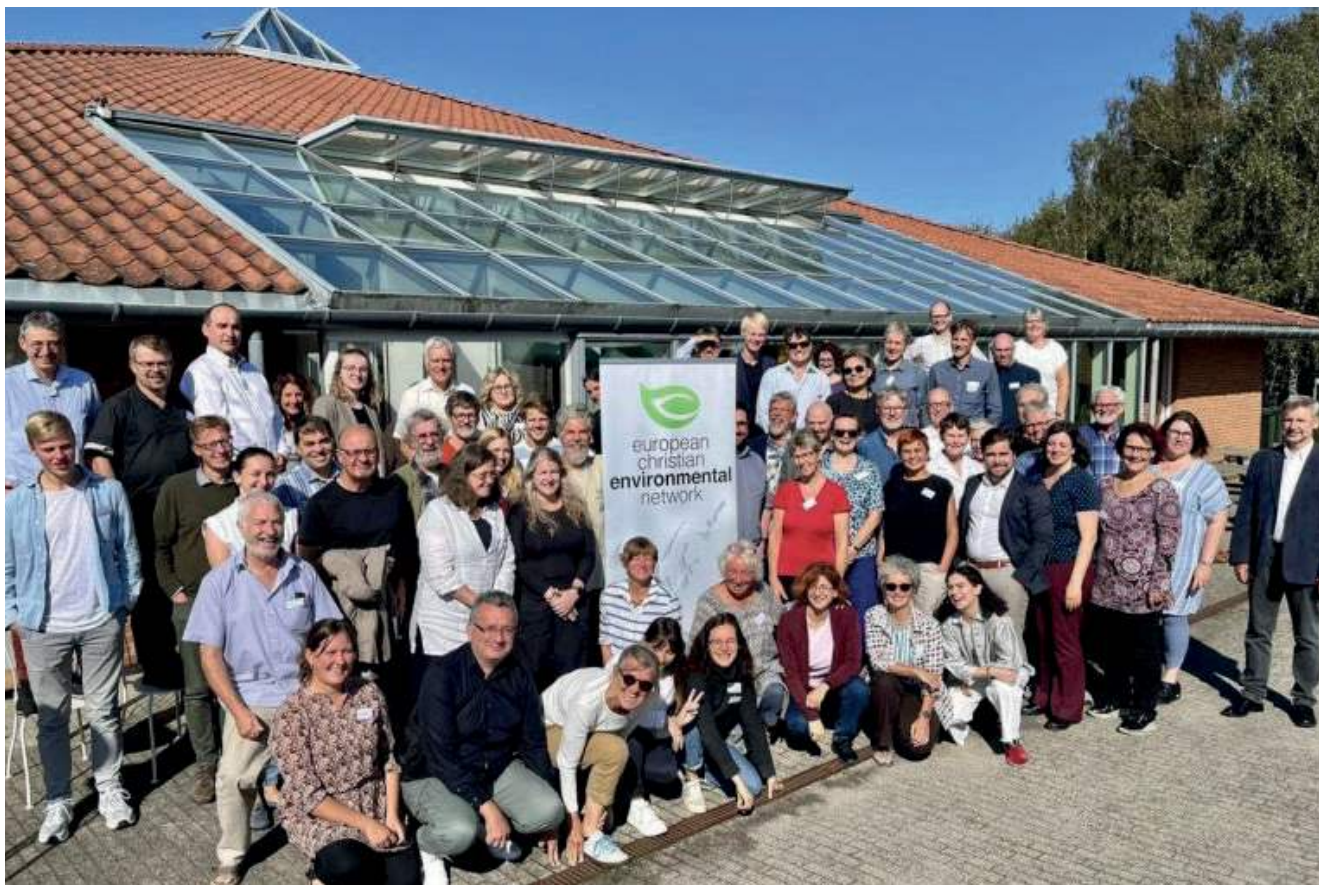
ECEN-forsamlingen 2023 i Roskilde, Danmark.

“ Vi har en rolle som kristne med en forpliktelse til å ta vare på planeten vår, å være samstemte både praktisk og relasjonelt, i våre kirker og fellesskap for å skinne, vise og dele gode ideer for å påvirke samfunnet vårt for det gode.