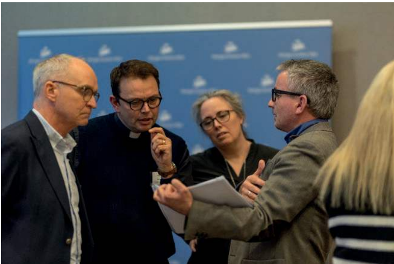
Teologiske diskusjoner under Faith and order-konferansen på Sundvollen 2023.

tidligere og er en viktig ressurs i hvordan kirkene kan legge til rette for en bedre arbeidshverdag for kvinner i disse rollene.