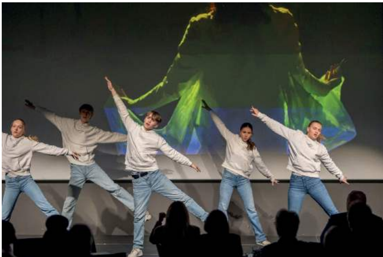
Vingespenn optrådte på generalforsamlingen i Norges Kristne Råd.

«Det overrasket meg det med pornoen. Visste ikke at så mange var tvunget til å gjøre ting de ikke ville».