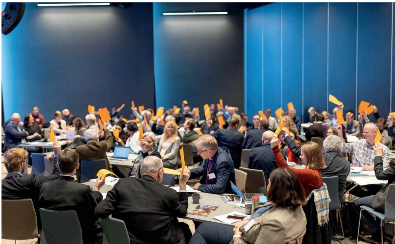
AVSTEMMING: Demokratiet rådet.