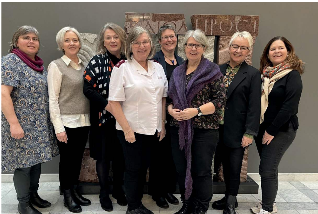
Nationalkomiteen for Kvinnenes internasjonale bønnedag, Norge.