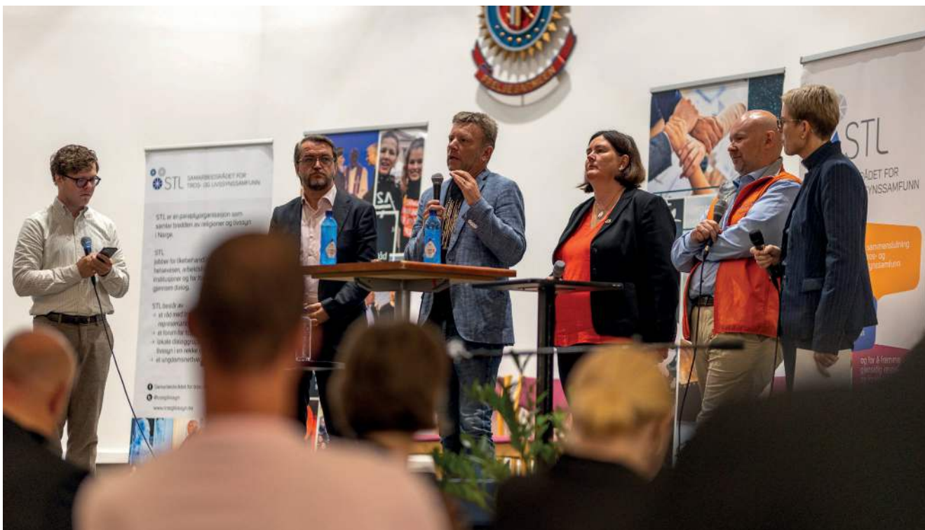
Deltakere i debatten om den nye trossamfunnsloven.

i religionsfriheten. Enig med HEF-fyren at man bør tenke likehandling – at staten ikke skal velge og sette kriterier. Mener alle har rett til det samme som Dnk. Skeptisk å gå inn på religionsfrihetens område.