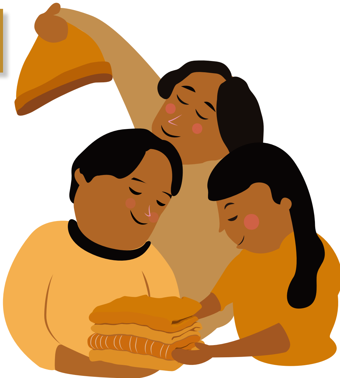
Illustrasjon: Bærekraftsboka, Mari Kvale