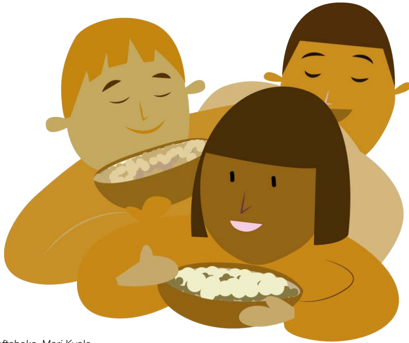
Illustrasjon: Bærekraftsboka, Mari Kvale