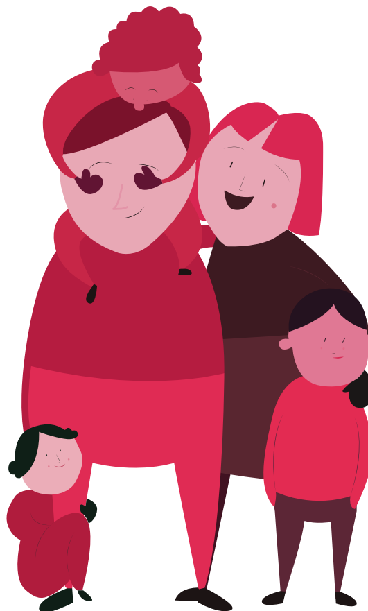
Illustrasjon: Bærekraftsboka, Mari Kvale