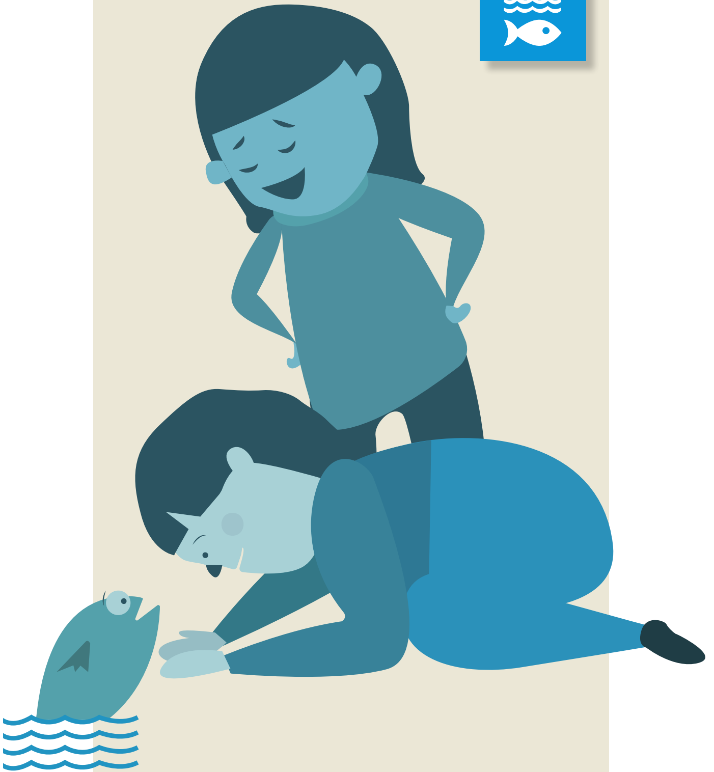
Illustrasjon: Bærekraftsboka, Mari Kvale