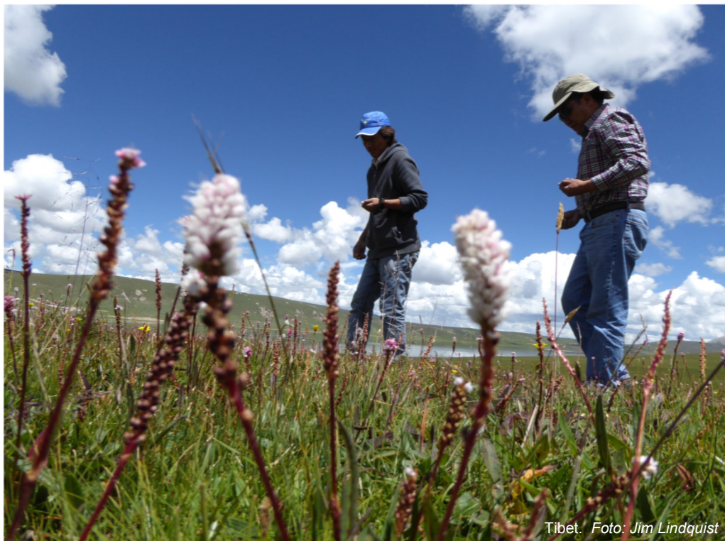
Tibet.