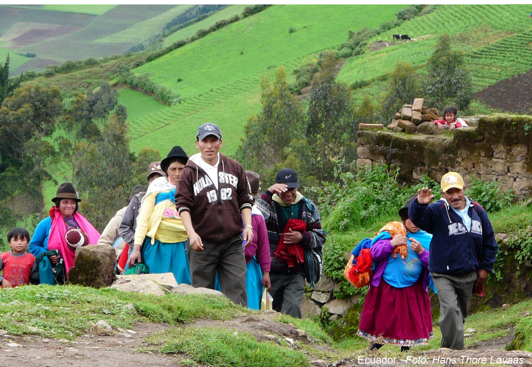
Ecuador - Foto: Hans Thore Løvaas

«Fortellingen om urfolk er en historie om handlekraft. De folkene som verden for 100 år siden trodde var dømt til å forsvinne, reiste seg mot alle odds og ble en stemme i det internasjonale samfunnet»