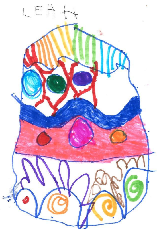
Barnetegninger med tema 'Påske' – tegnet av Mia og Leah fra Kongsvik barnehage